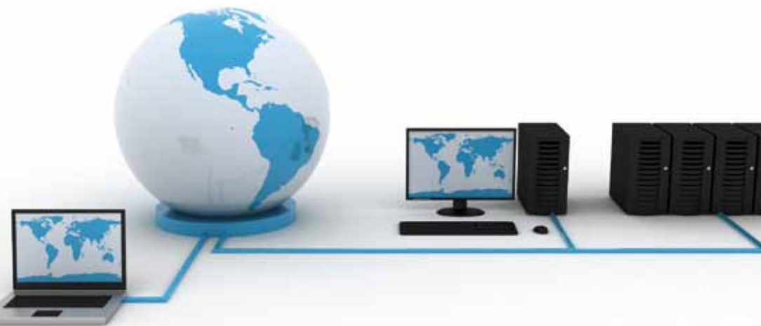
TMS Share Funktionsweise