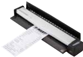
Abbildung: ScanSnap S1100

Dabei unterstützt die ScanSnap Serie unterschiedliche Formate - vom Kleinformat einer Visitenkarte bis zu DIN A4.