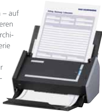
Abbildung: ScanSnap S1500

Kompakt und leicht zu bedienen – auf Knopfdruck scannen und archivieren Sie direkt in die cloud-basierte Archivierungslösung! Die ScanSnap Serie von Fujitsu macht Scannen für jeden Anwender einfach. Mit nur wenigen Handgriffen und sekundenschnell steht Ihr Dokument in bestechender Qualität zur Archivierung bereit – ob im stationären Desktopbetrieb oder als mobiler Begleiter.