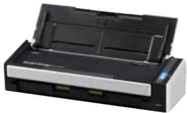
Abbildung: ScanSnap S1300